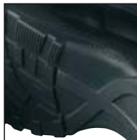
Neu entwickelte Sohle

Obermaterial: Geschmeidiges Anilinleder, hydrophobiert, durch spezielle Gerbungsmethoden hoch atmungsaktiv (10,0 mg/cm 2 /h), 2,0 – 2,2 mm dick